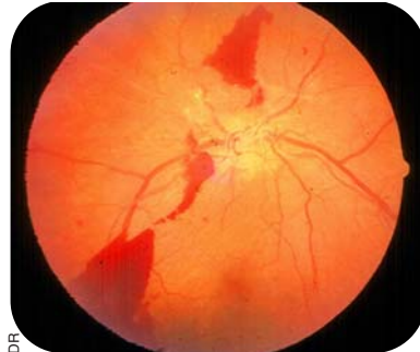
Rétinopathie diabétique proliférante